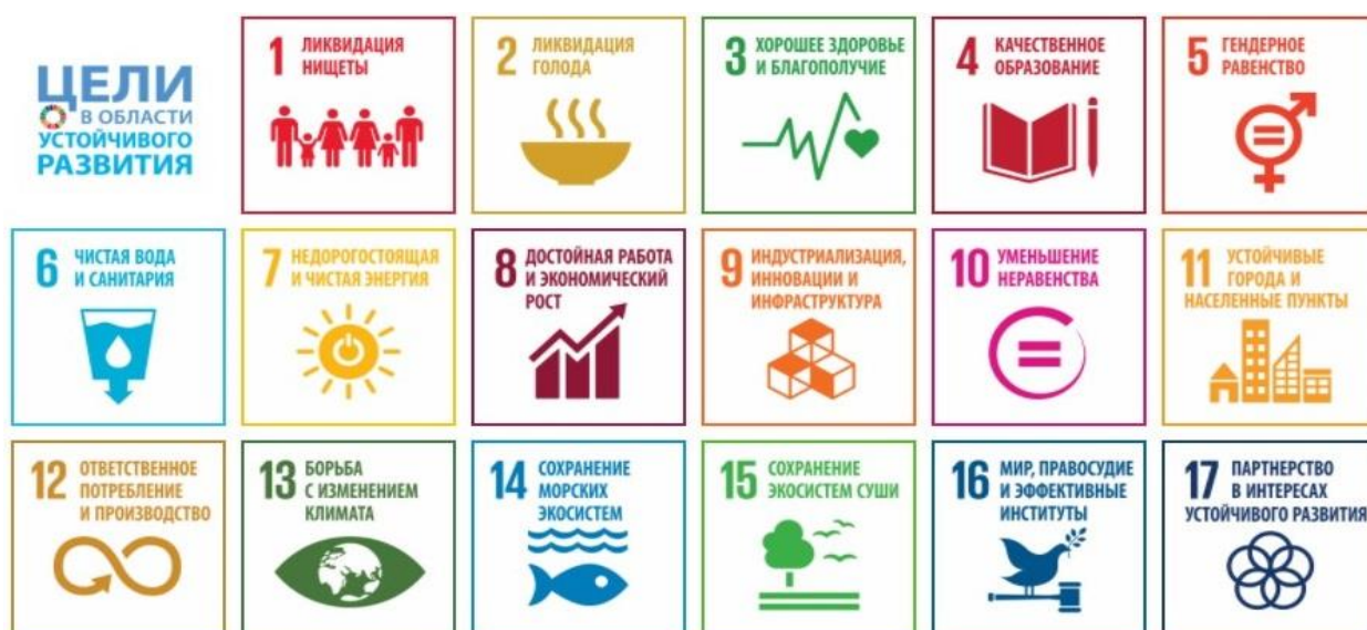
Рисунок 1. Цели устойчивого развития

В сентябре 2019 года на Политическом форуме высокого уровня было отмечено, что мир «отстает от графика» достижения целей устойчивого развития (рис. 1), сформулированных ООН в 2015 году 193 государствами-членами и не успевает к 2030 году решить большинство задач.