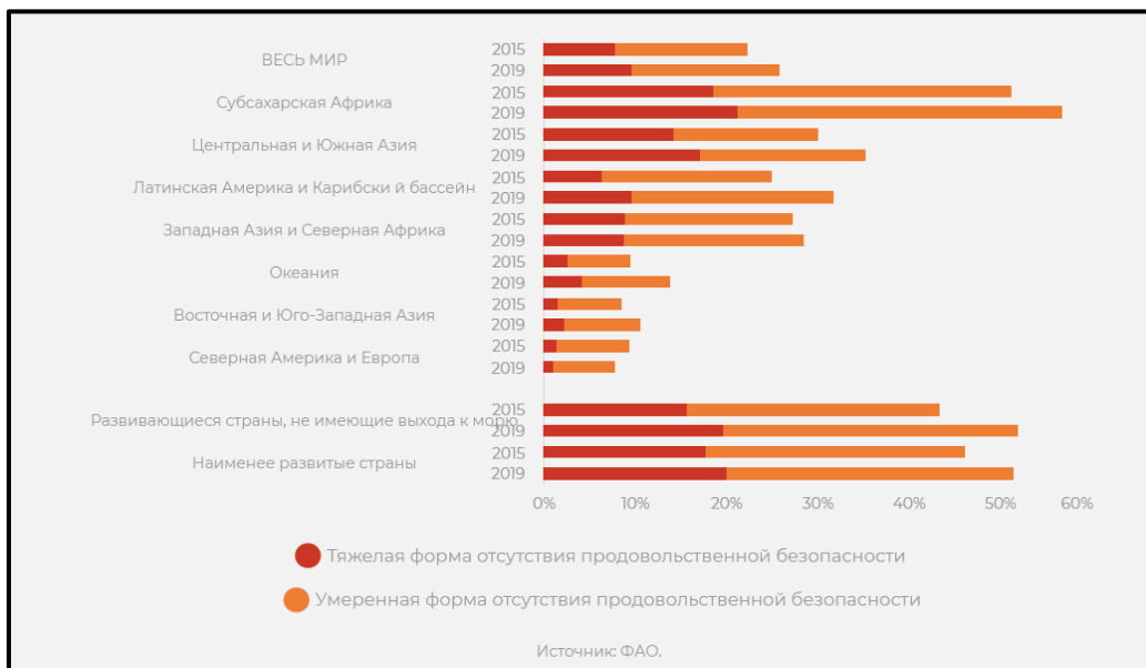
Рисунок 3. Распространенность отсутствия продовольственной безопасности в тяжелой и умеренной формах в 2015 и 2019 годах в разбивке по регионам